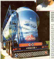
Die Augen des Herrmann sind im Blickfeld der Zugmaschine